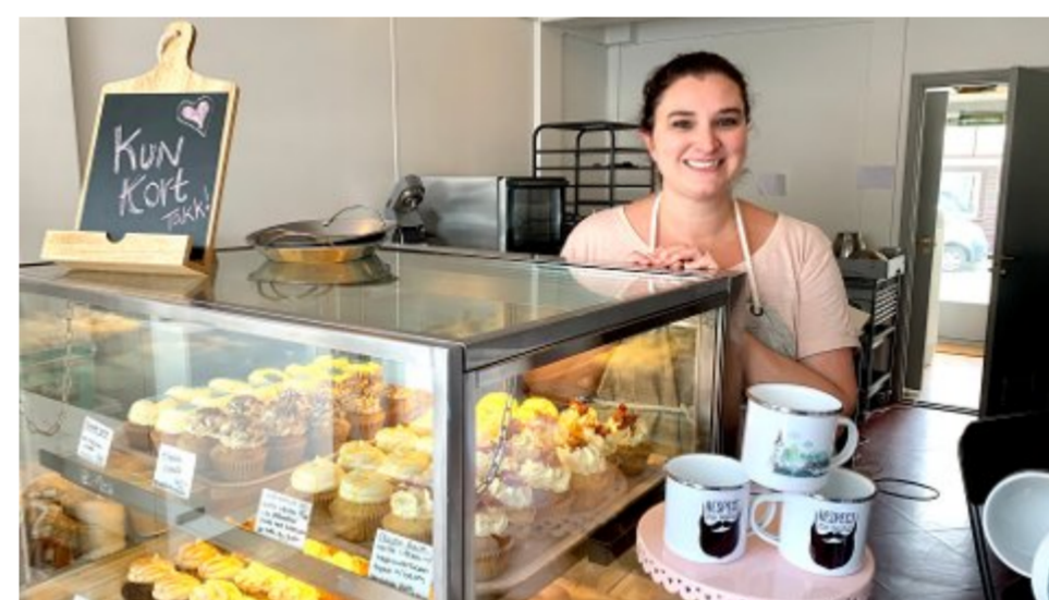
Feiret et år med cupcakes