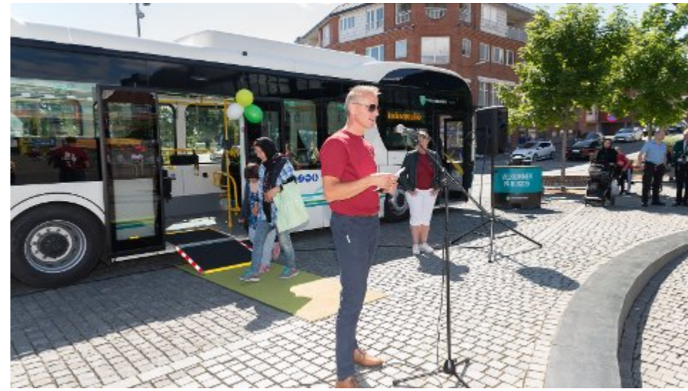
Nå er de nye bussene på veien